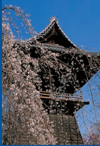
慈眼寺のしだれ桜／4月