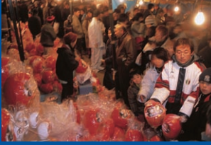
少林山だるま市／1月・達磨寺