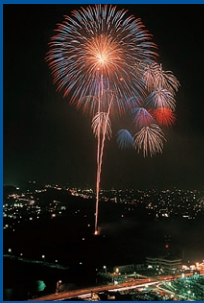
花火大会／8月・烏川河川敷