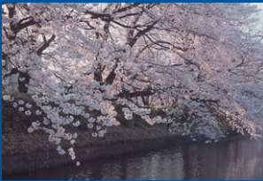
お堀の桜／4月・高崎城址跡