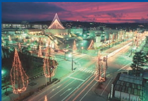
光のページェント／12月・市庁舎周辺