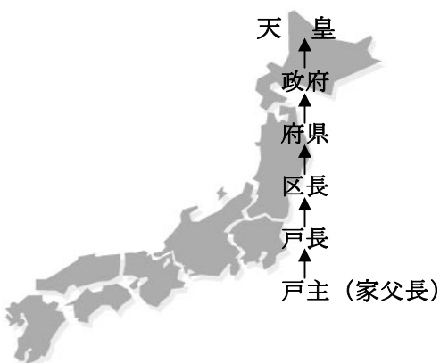
図1—明治国家の中央集権化統制図

住居地によって戸籍を再編成し、家族の地位順は戸主を一番に、下は儒教的な順番で尊属、直系、男性を上、卑属、傍系、女性を下という親族集団の配列にしたのである。これは戸主優位の確立と戸主が家族員に対する統制を可能にした根拠を提供した同時に、家の中の秩序と各家族員の地位を明確にしたものであると思われる。