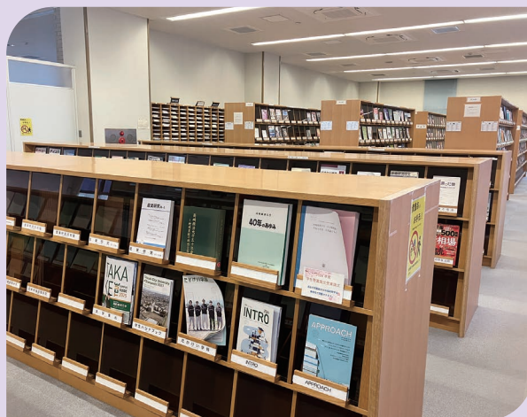
受賞作品は、図書館に所蔵されます