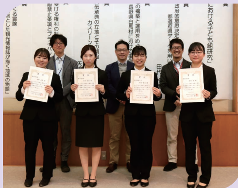
令和5年度の受賞者