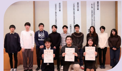
令和2年度の受賞者