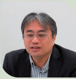
中村 匡克 教授